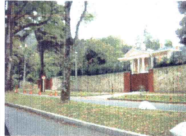
ALTERACIONES A LA EDIFICACION ORIGINAL VISIBLES DESDE EL EXTERIOR :